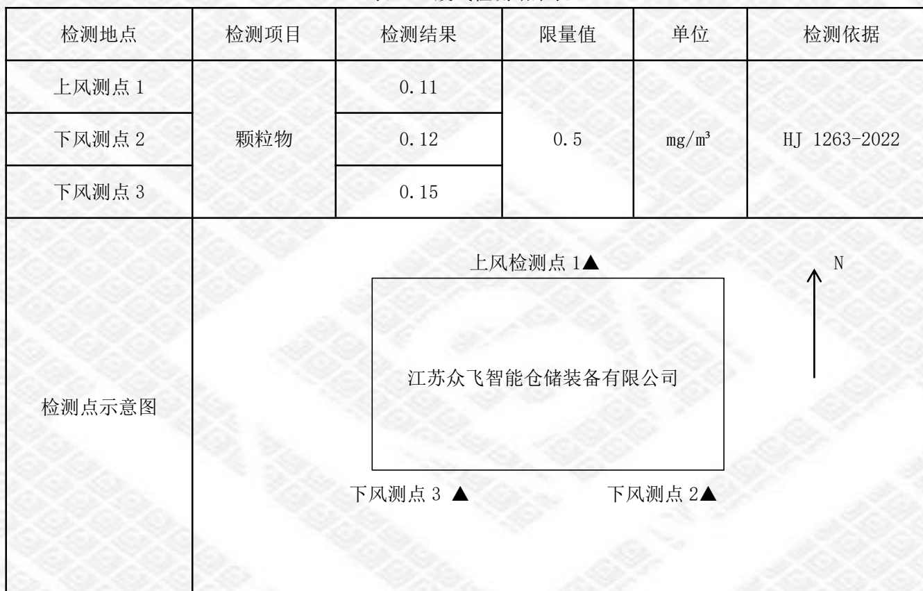
表 3-1 废气检测结果表

This report shall not be altered, increased or deleted. The results shown in this test report refer only to the sample(s) tested. Without written approval of Hongyi Testing, this test report shall not be copied except in full and published as advertisement Hongyi Physical & Chemical Lab.