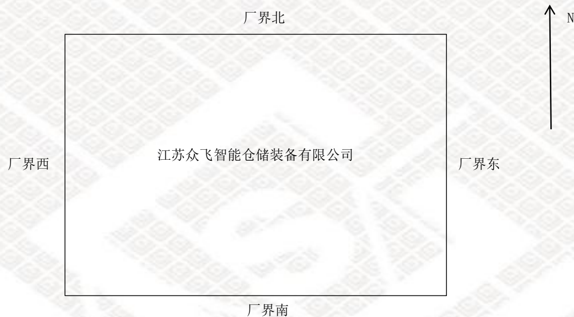
噪声检测点示意图

This report shall not be altered, increased or deleted. The results shown in this test report refer only to the sample(s) tested. Without written approval of Hongyi Testing, this test report shall not be copied except in full and published as advertisement Hongyi Physical & Chemical Lab.